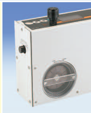
大型フィルター採用