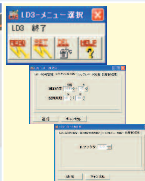
ソフト付通信ケーブル標準付属