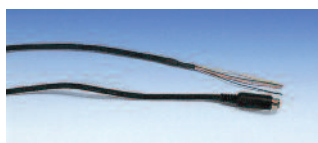
アナログ・パルスケーブル

※動作可能OS：日本語Windows98/Me/2000/XP/Vista/7 ※ソフト付通信ケーブルはUSBタイプを標準付属しています。RS-232Cタイプは別売品です。 ●日測協校正付（080000-501）は¥478,000になります。日測協におけるLD-5D型の標準校正範囲は、0~3mg/m 3 について保証されています。