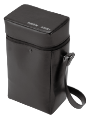
キャリングケース