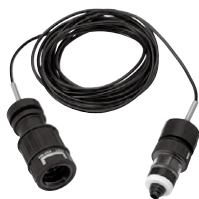
リモートケーブル5m